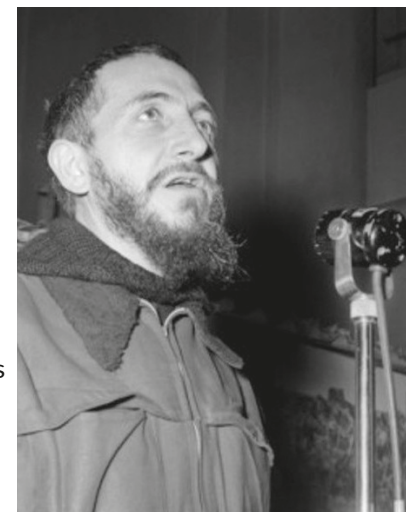
L'Abbé Pierre - 1er février 1954 - l'Appel sur les ondes de Radio Luxembourg »

Dans cette myriade d'activités et d'organisations, nous vous proposons dans ce deuxième numéro du Mag « Emmaüs Sacré Dressing », de faire un focus sur l'action « Economie solidaire et Insertion » du Mouvement. Outre un article de fond sur l'Insertion par l'Activité Économique et Sociale, nous allons vous partager notre expérience de 15 années dans ce domaine au travers de chiffres, témoignages et autres indicateurs qui vous permettront de mieux comprendre notre Utilité Sociale.